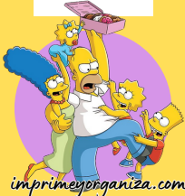
TABLA DEL 8

7x1=7 7x2=14 7x3=21 7x4=28 7x5=35 7x6=42 7x7=49 7x8=56 7x9=63 7x10=70