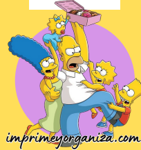
TABLA DEL 4

3x1=3 3x2=6 3x3=9 3x4=12 3x5=15 3x6=18 3x7=21 3x8=24 3x9=27 3x10=30