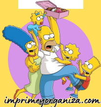
TABLA DEL 9

8x1=8 8x2=16 8x3=24 8x4=32 8x5=40 8x6=48 8x7=56 8x8=64 8x9=72 8x10=80