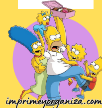
TABLA DEL 11

10x1=10 10x2=20 10x3=30 10x4=40 10x5=50 10x6=60 10x7=70 10x8=80 10x9=90 10x10=100