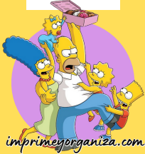
TABLA DEL 2

1x1=1 1x2=2 1x3=3 1x4=4 1x5=5 1x6=6 1x7=7 1x8=8 1x9=9 1x10=10