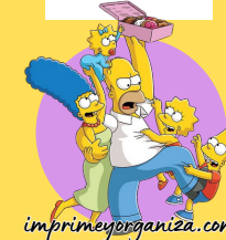
TABLA DEL 12

11x1=11 11x2=22 11x3=33 11x4=44 11x5=55 11x6=66 11x7=77 11x8=88 11x9=99 11x10=110