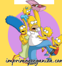
TABLA DEL 5

4x1=4 4x2=8 4x3=12 4x4=16 4x5=20 4x6=24 4x7=28 4x8=32 4x9=36 4x10=40