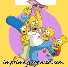
TABLA DEL 7

6x1=6 6x2=12 6x3=18 6x4=24 6x5=30 6x6=36 6x7=42 6x8=48 6x9=54 6x10=60