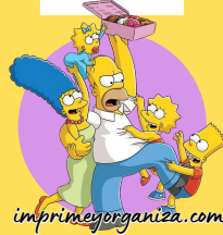
TABLA DEL 3

2x1=2 2x2=4 2x3=6 2x4=8 2x5=10 2x6=12 2x7=14 2x8=16 2x9=18 2x10=20