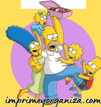
TABLA DEL 10

9x1=9 9x2=18 9x3=27 9x4=36 9x5=45 9x6=54 9x7=63 9x8=72 9x9=81 9x10=90